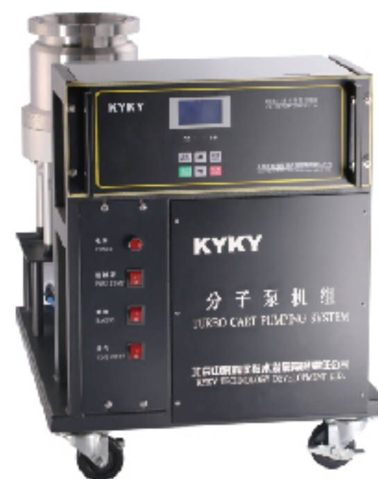
北京中科科仪股份有限公司 KYKY TECHNOLOGY CO., LTD.